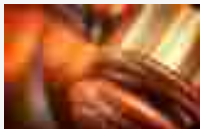
Istituzione del primo LLM americano in Italia