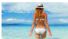
Moda e Bellezza: consigli e segreti