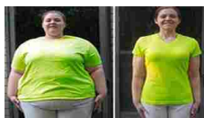
Mamma perde più di 12kg in 1 mese usando questa nuova pillola a soli 39€...