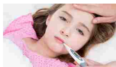
Influenza 2015: picco massimo, febbre alta. Ecco gli strumenti per curarla