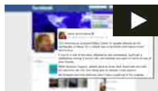
In caso di disastro Facebook ti chiede se stai bene