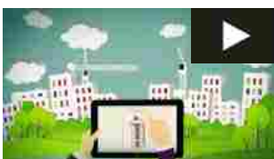
Tre video per raccontare l'uso artistico di Surface Pro 3