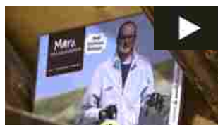
Rivoluzione olandese: la patata coltivata con l'acqua di mare