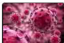
Sovaldi: accertamenti dei Nas negli uffici delle Regioni