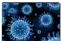
Epatite C, Alfa approva rimborsabilità daclatasvir