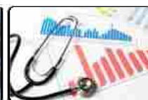
CEIS Tor Vergata, la spesa diminuisce ma bisogna ripensare il Ssn