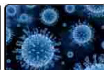
Anti-Hcv, l'associazione EpaC: massima vigilanza su operato Regioni