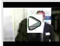
CONVEGNO “IL PRICING DEI FARMACI INNOVATIVI”. Roma, 12...