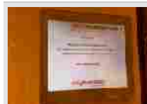
“PATIENT SUPPORT PROGRAMS”- Evento